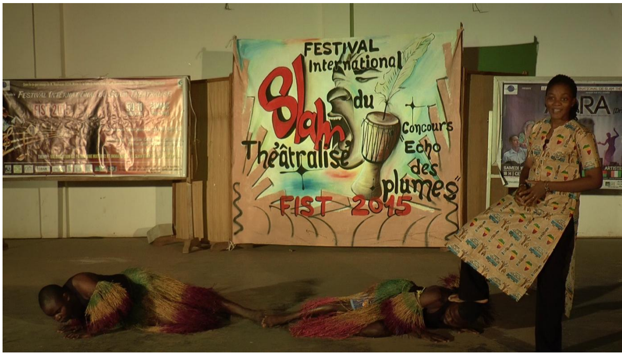
Les slameurs invités du Bénin, du Togo, Burkina, Mali, Côte d'Ivoire et du Niger pour le FIST avec le Maire de Porto-Novo et la Promotrice du festival